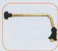
código 4751 Barra curva 120°