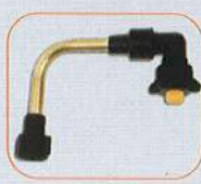
código 4750 Barra com bico rotativo 360°