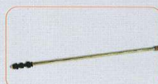
código 4748 Barra telescópica 0.66m a 1.24m